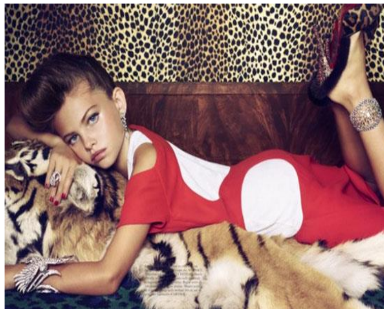
Figura 15: “Editorial Cardeaux”, Trendlend, s/a