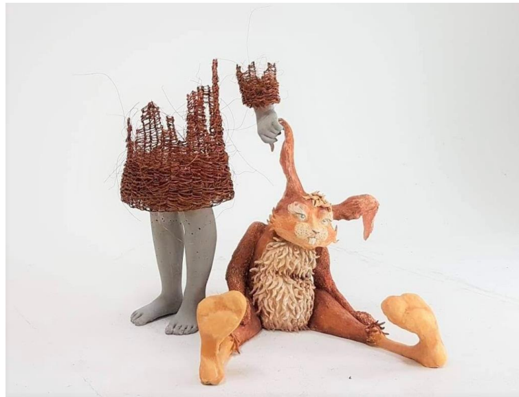
Figura 17: Obra de Lene Kilde, 2018