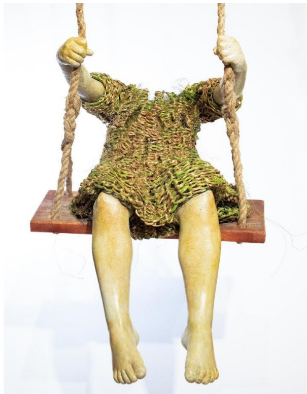
Figura 16: Obra de Lene Kilde