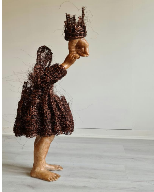
Figura 23: Obra de Lene Kilde

Fonte: https://www.instagram.com/p/CX6uMSWMUbK/?igshid=NTdlMDg3MTY=