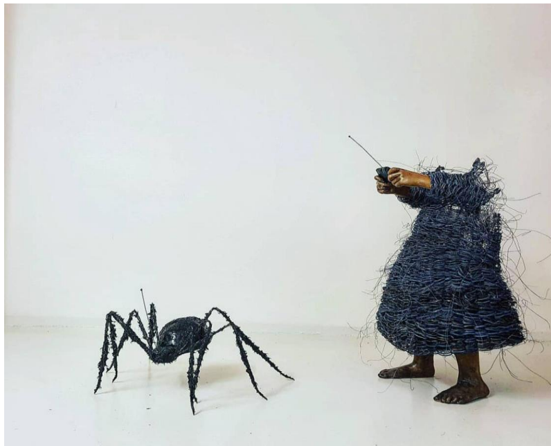
Figura 22: Obra de Lene Kilde