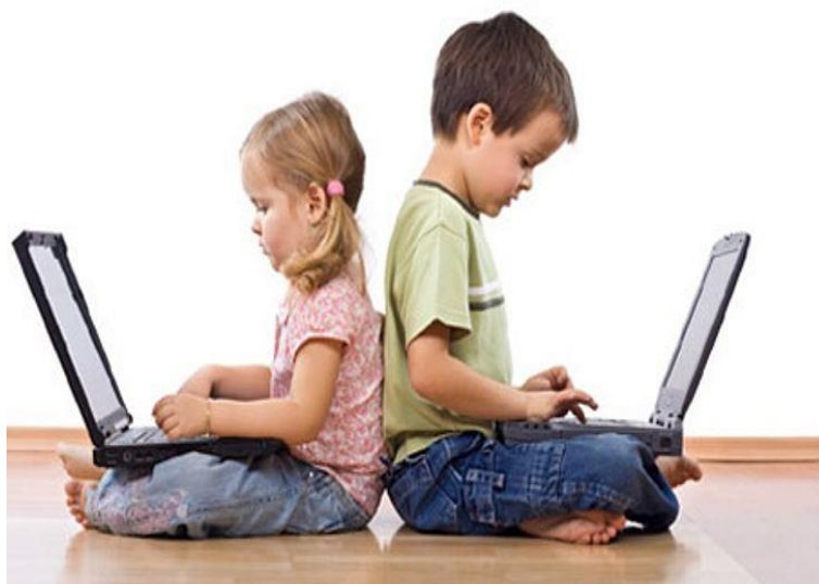
Figura 5: 4daddy

Fonte: https://4daddy.com.br/como-protger-seus-filhos-dos-perigos-da-internet/