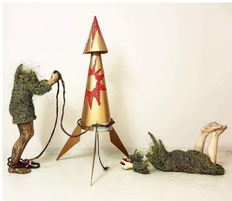
Figura 18: Obra de Lene Kilde, 2021