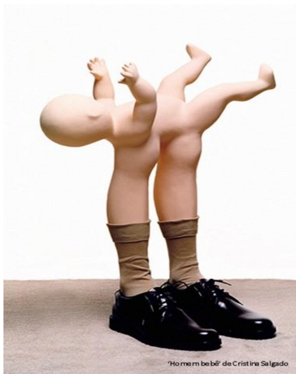
Figura 2: “Homem Bebê” de Cristina Salgado, 2009.