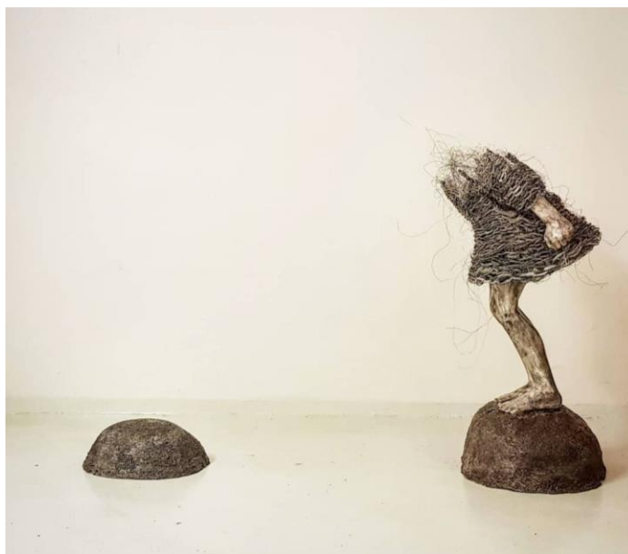
Figura 21: Lene Kilde