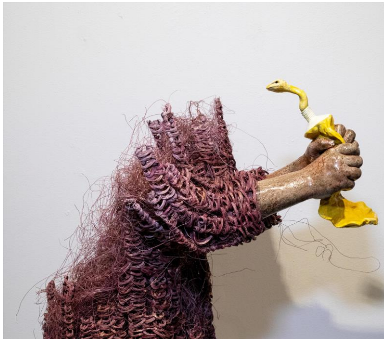
Figura 19: Obra de Lene Kilde