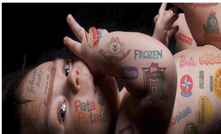
Figura 9: RedeNutri, 2016