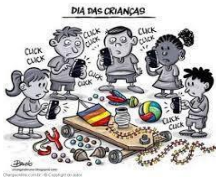
Figura 7: Vida & Ação, 2016