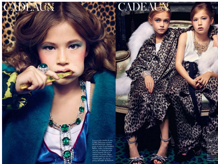
Figura 13: “Editorial Cadeaux”, Trendland, s/a