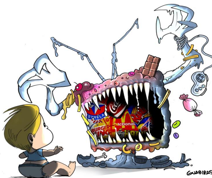
Figura 8: Pinterest, Guabiras Cartunista