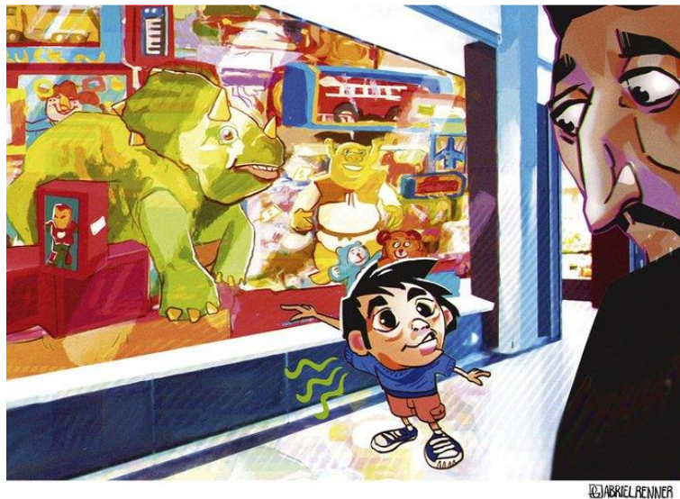
Figura 10: GZH, 2019