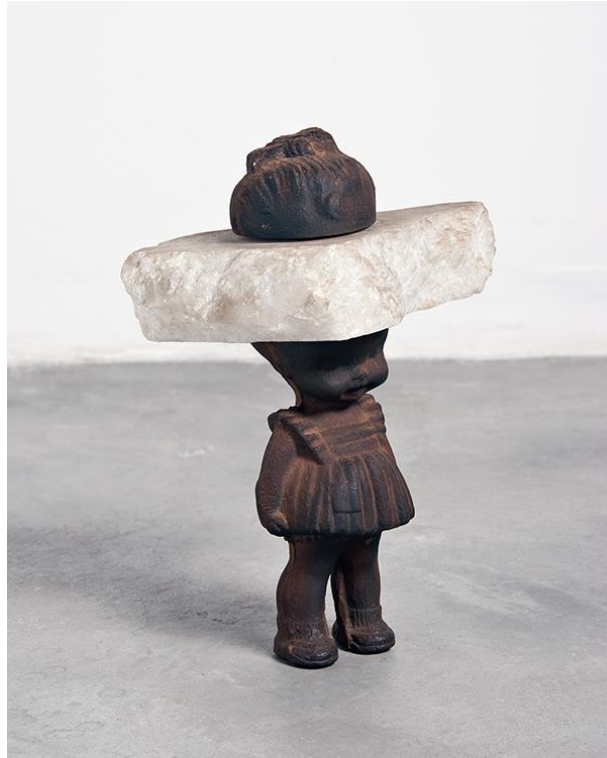
Figura 1: “Série Meninas” de Cristina Salgado, 1993.