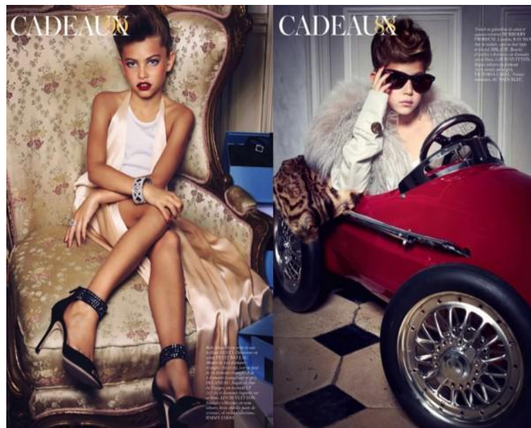
Figura 14: “Editorial Caudeaux”, Trendlend, s/a.