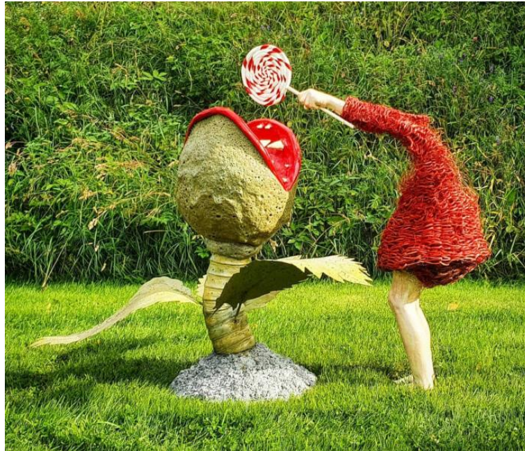
Figura 20: Obra de Lene Kilde