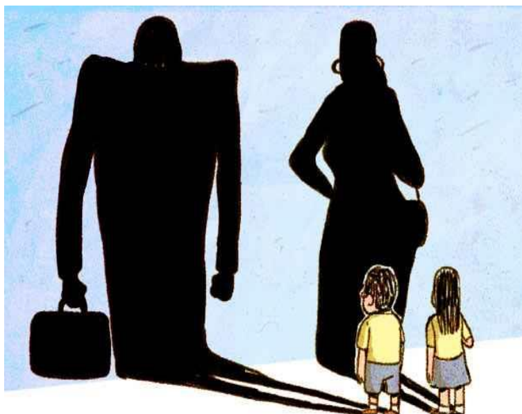
Figura 4: Diário de Pernambuco