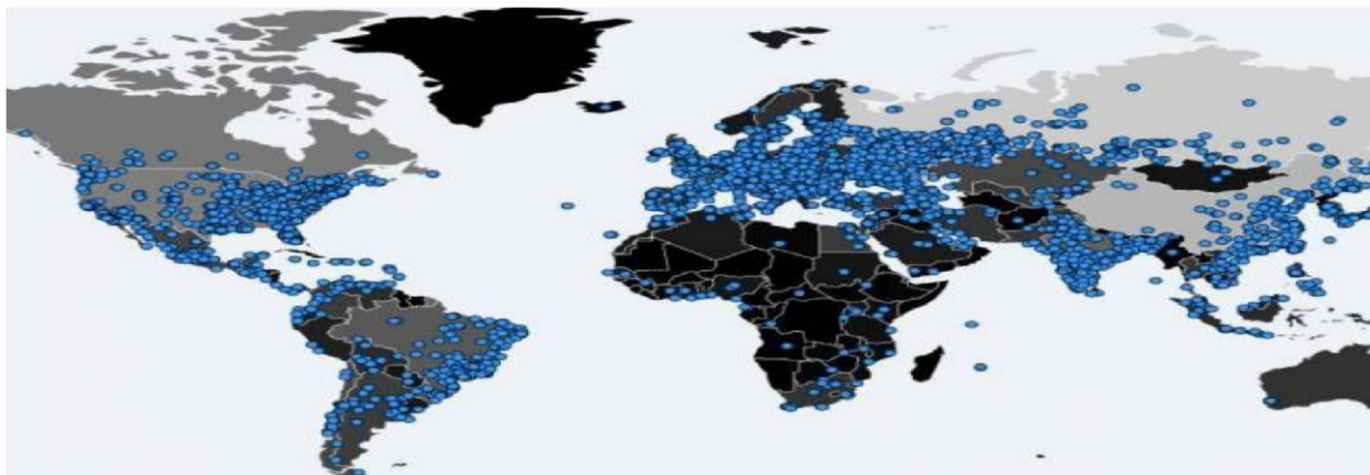
Figura 1. Imagem representativa do ataque do ransomware.

mostra a Figura 1, foi alvo desse ataque. Nesse ataque muitas empresas tiveram seus dados sequestrados e algumas empresas não conseguiram sobreviver, pois eram de pequeno porte e tiveram que fechar para se prevenir de novos ataques (segurança de dados) (TANENBAUM, 2011).